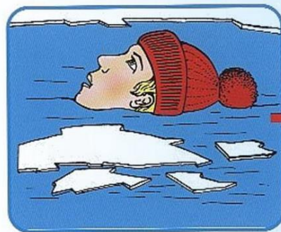
Не погружаться в воду с головой