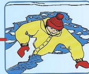
Забросить на лед ногу, откатиться от полыньи