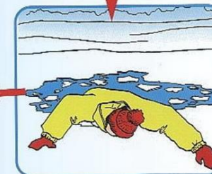
Наползть на лед, раскинув руки в стороны