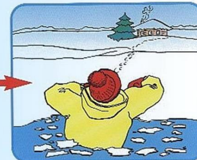
Выбраться в сторону, с которой произошло падение