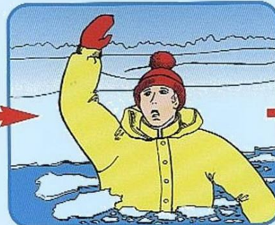
Не паниковать, позвать на помощь