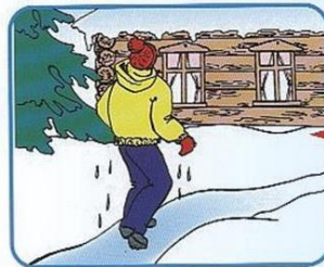
Не отдыхая, бежать к ближайшему жилью